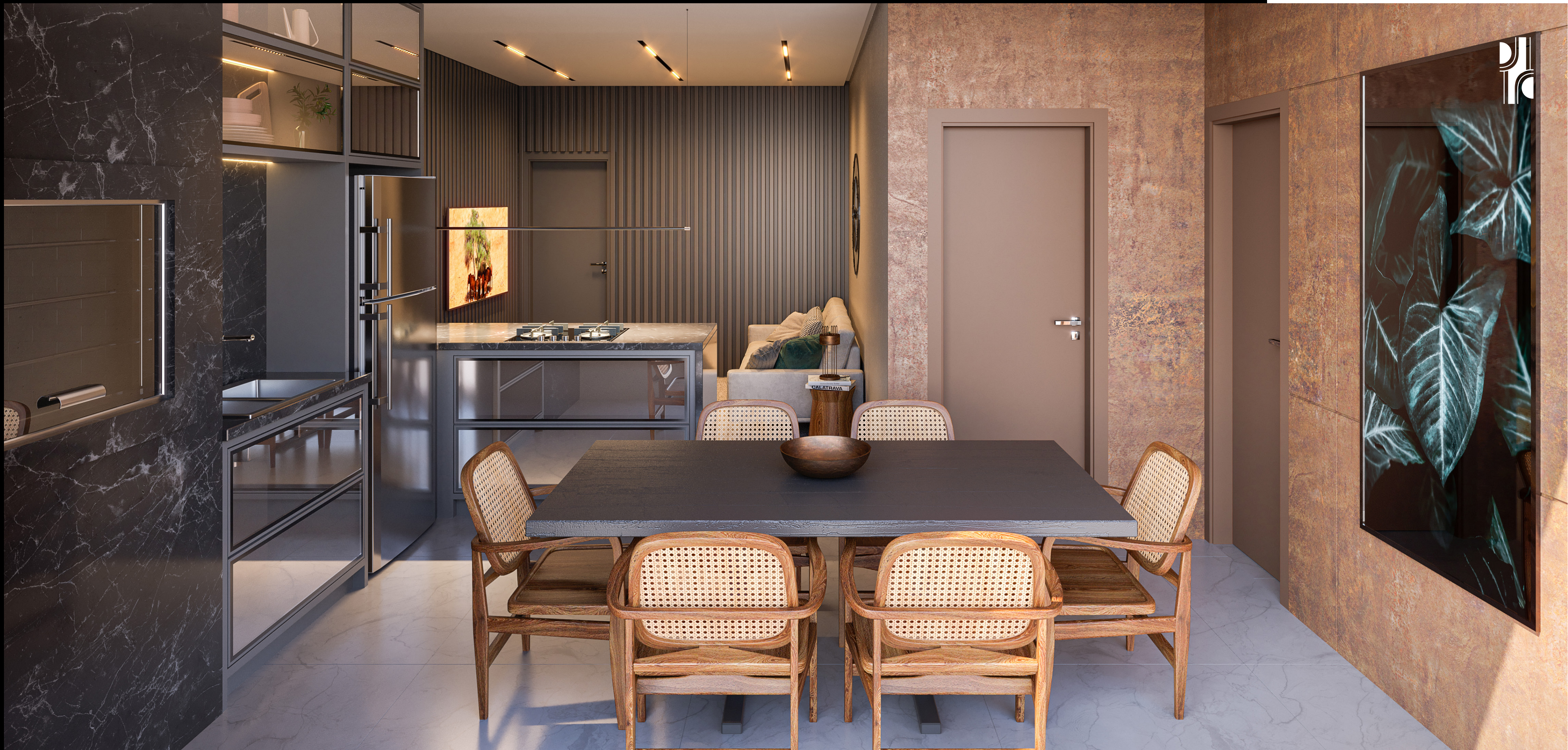
Living - Tipo Canto D