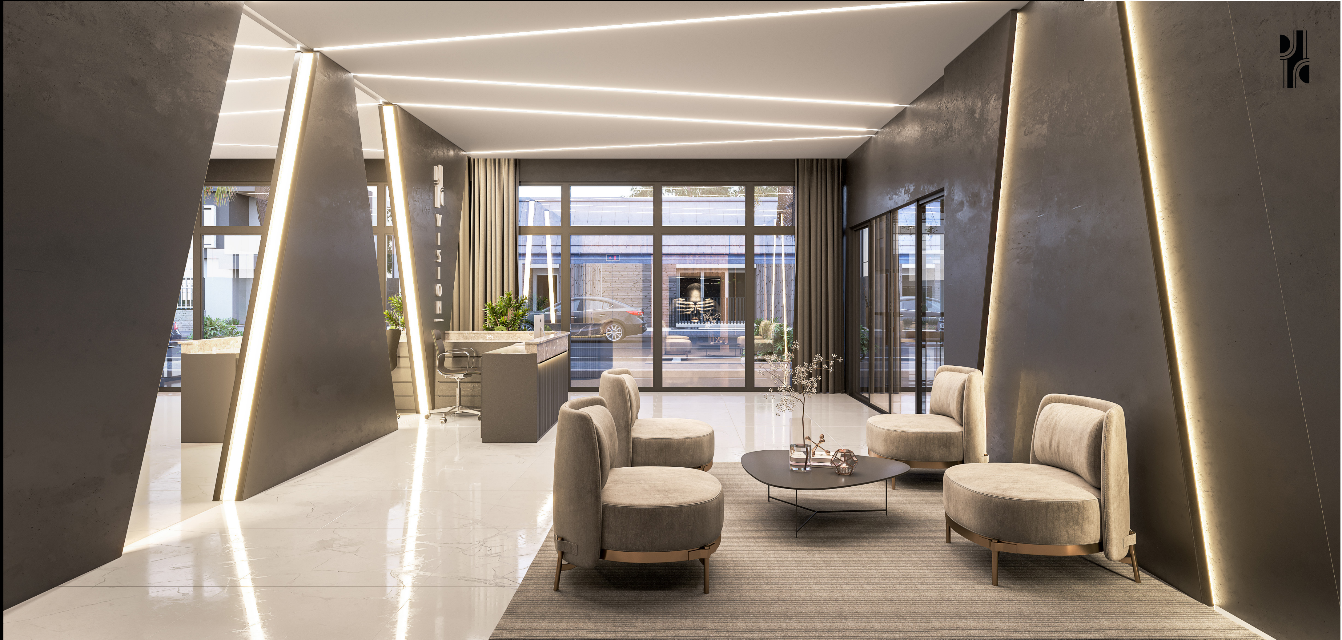
Hall de Entrada