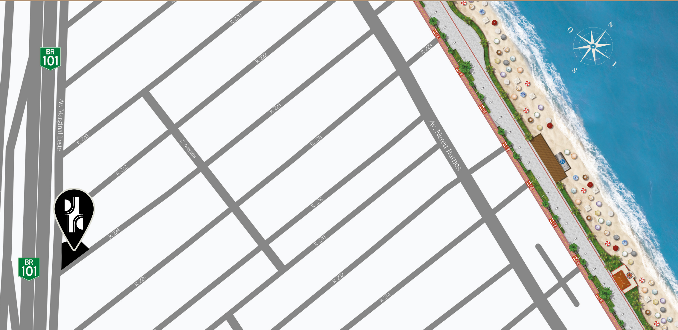
RUA 224 • Esquina com a marginal • ITAPEMA • SC