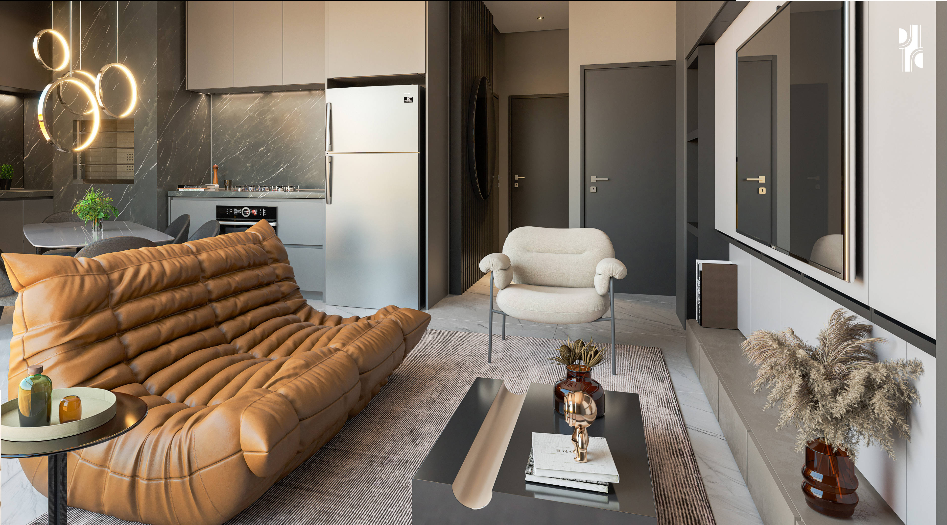
Living - Apto 01