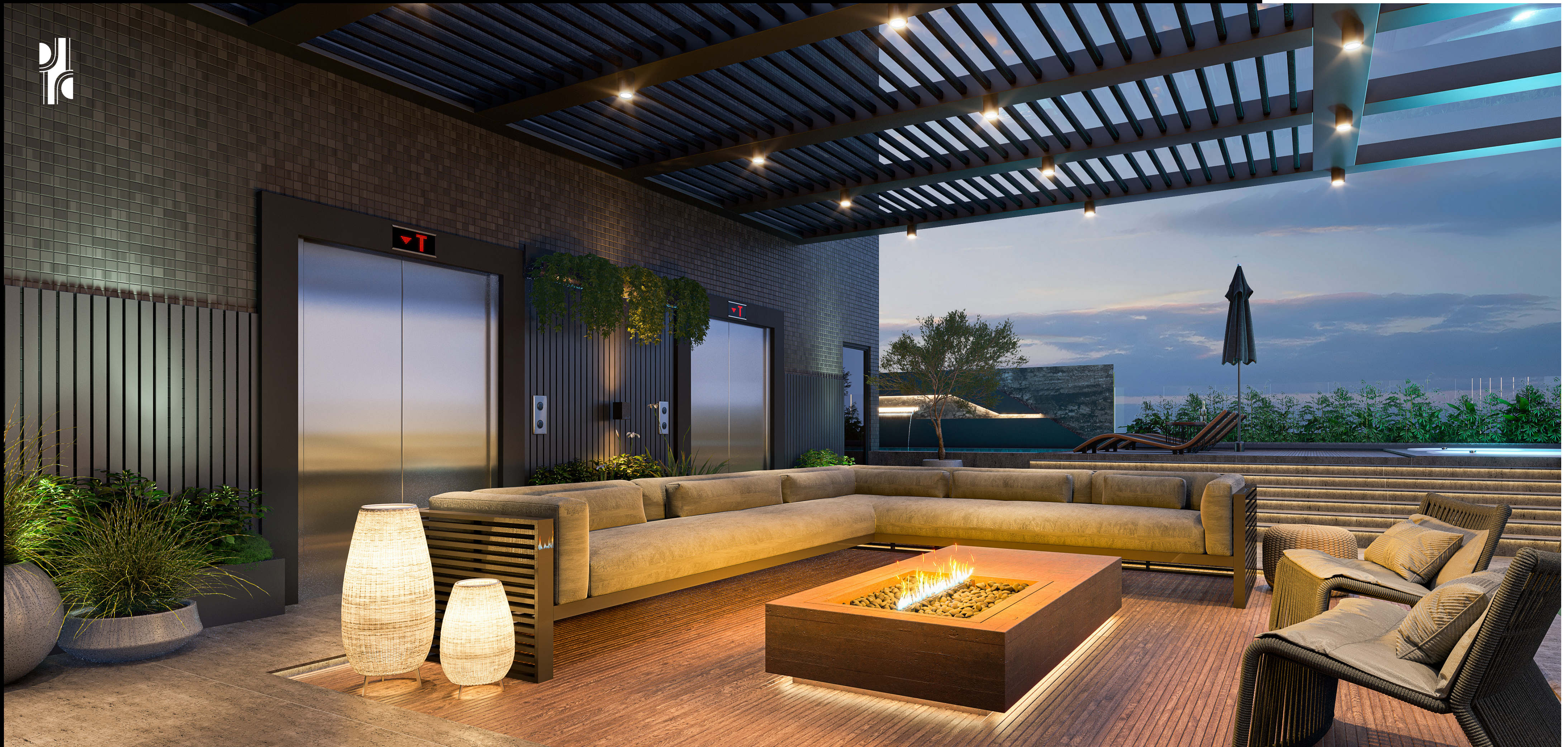
Praça de fogo