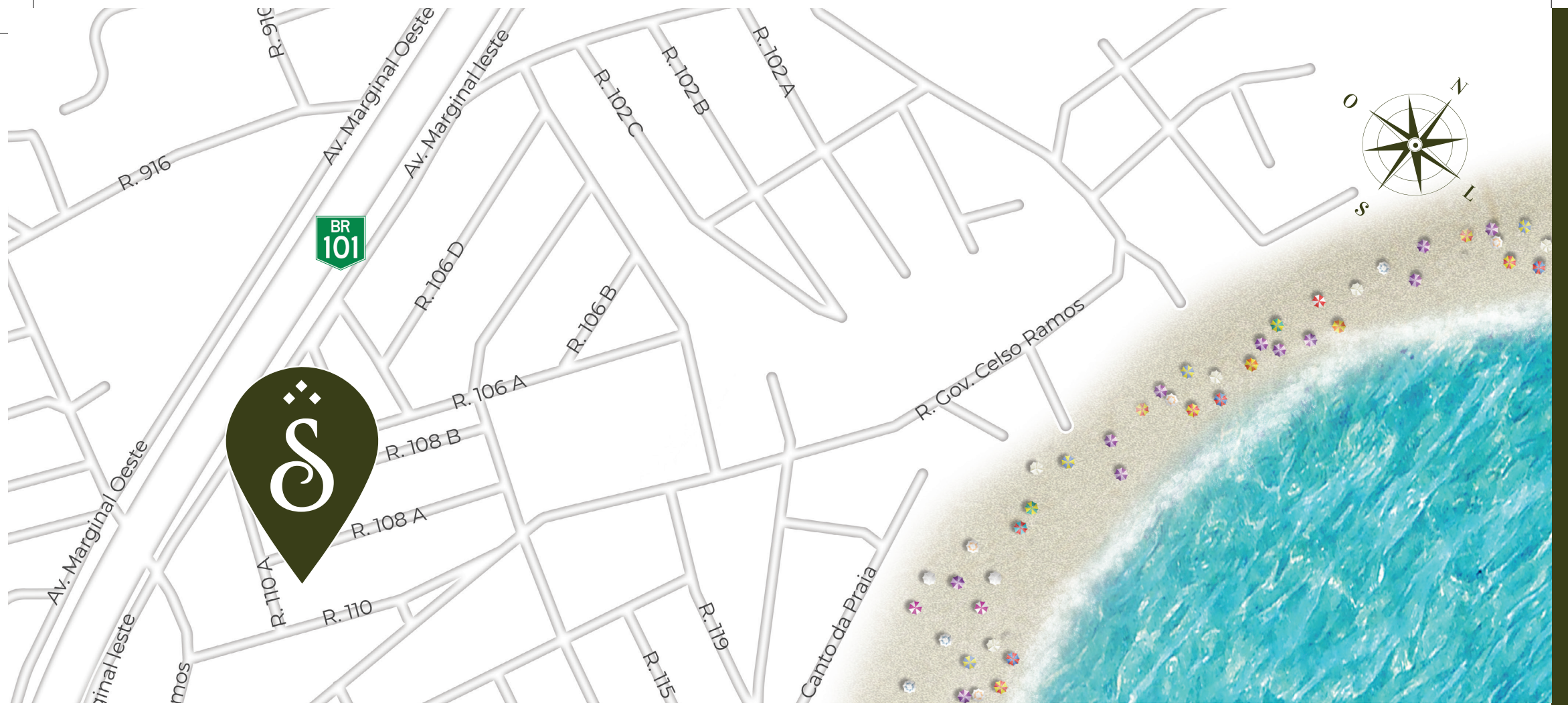
RUA 110 . RUA 110 A . RUA 108 A - CENTRO - ITAPEMA - SC