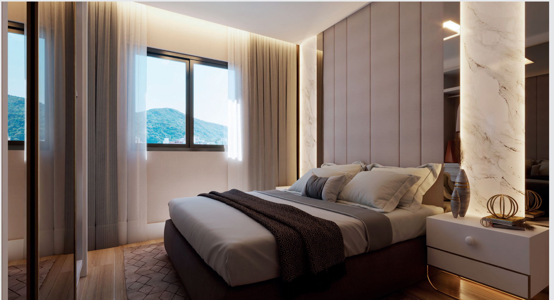
SUÍTE - APTO TIPO