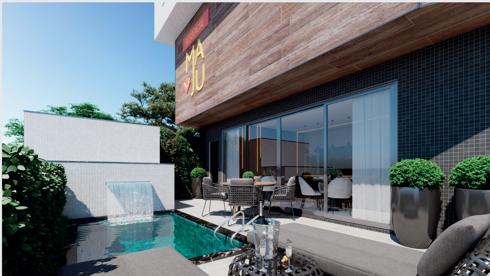
TERRAÇO COM SPA

De acordo com a lei 4591/64, informamos que as imagens e ilustrações contidas neste material possuem caráter exclusivamente promocional. Os móveis, assim como alguns materiais de acabamento representados nas ilustrações e plantas, não fazem parte do contrato. O apartamento será entregue conforme indicado no memorial descritivo, podendo haver modificações em função do projeto estrutural sem aviso prévio.