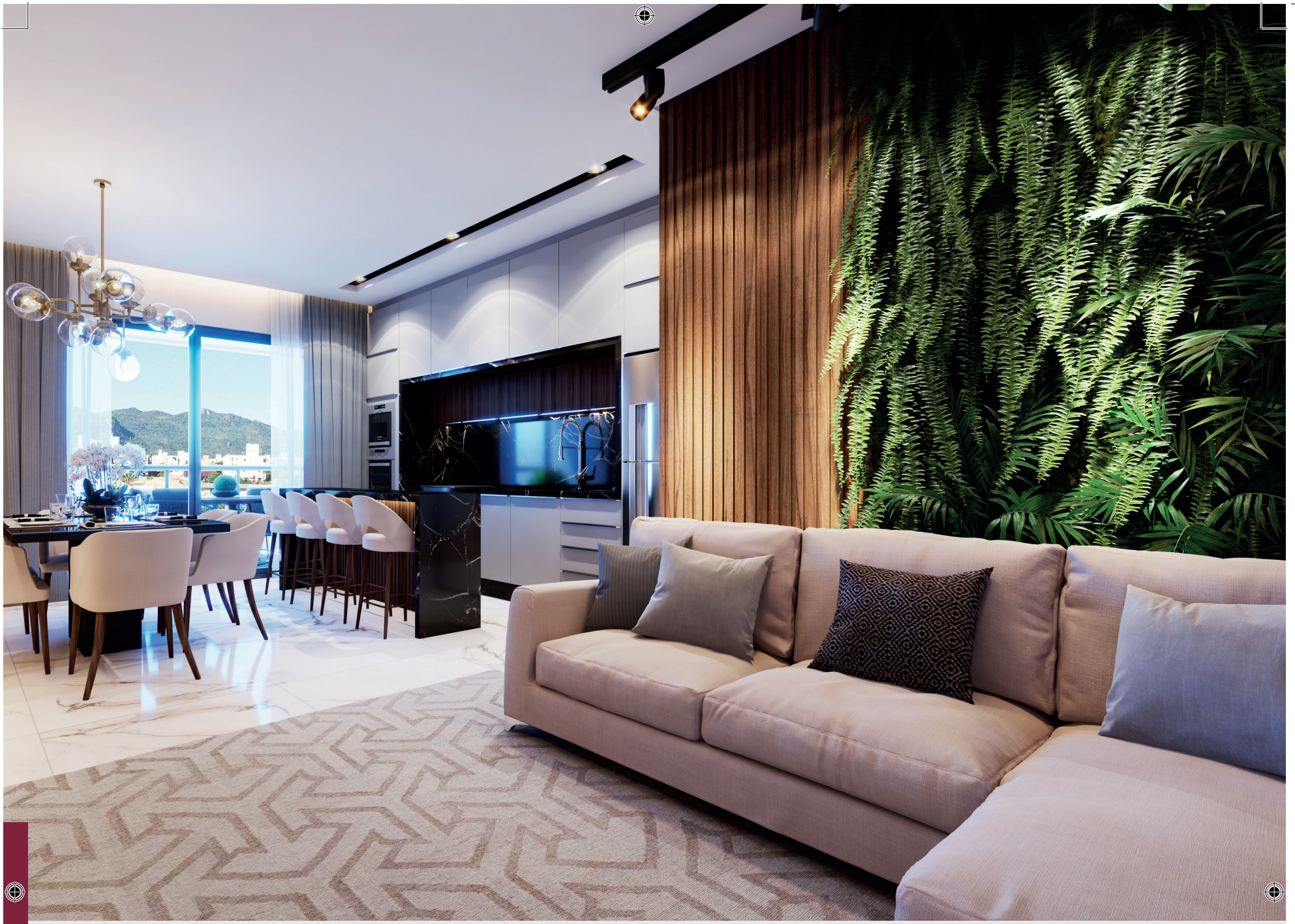
LIVING - APTO TIPO