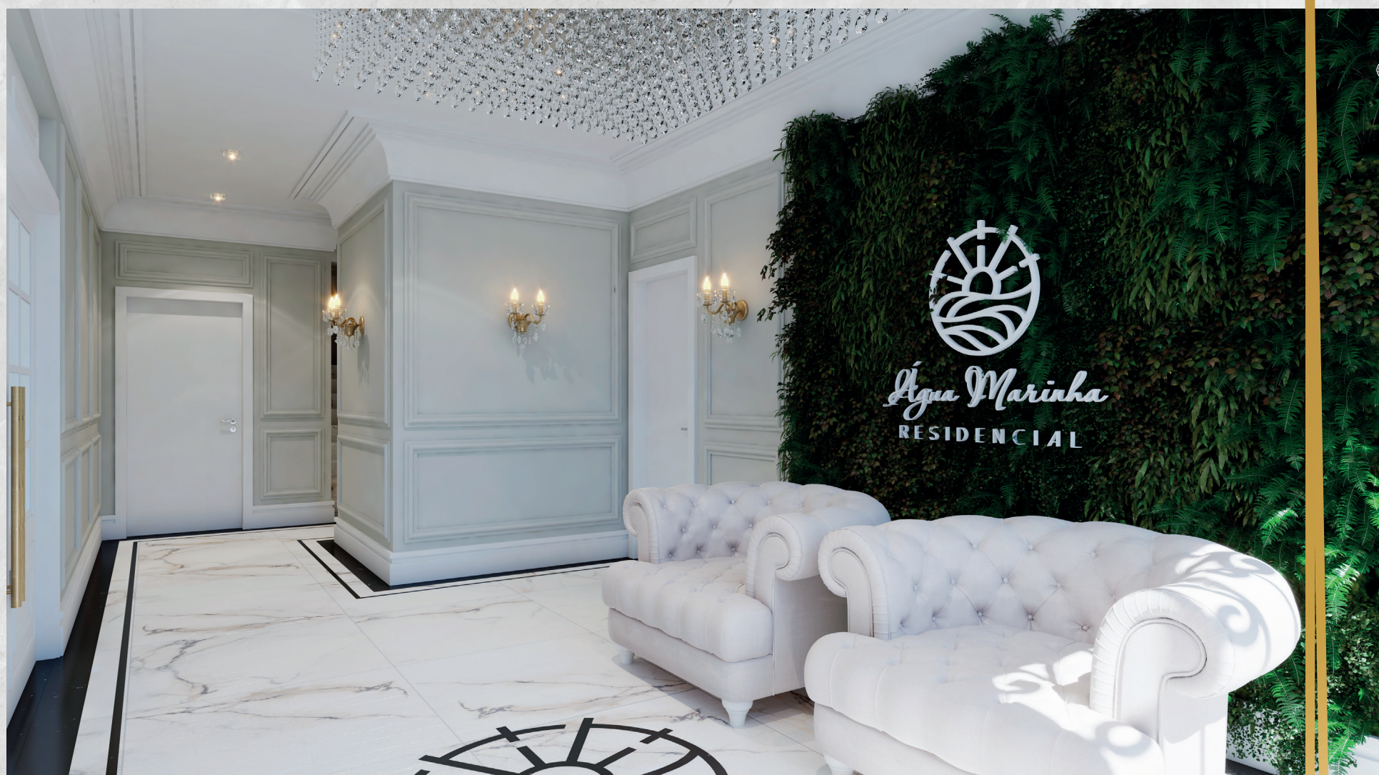
Hall de Entrada